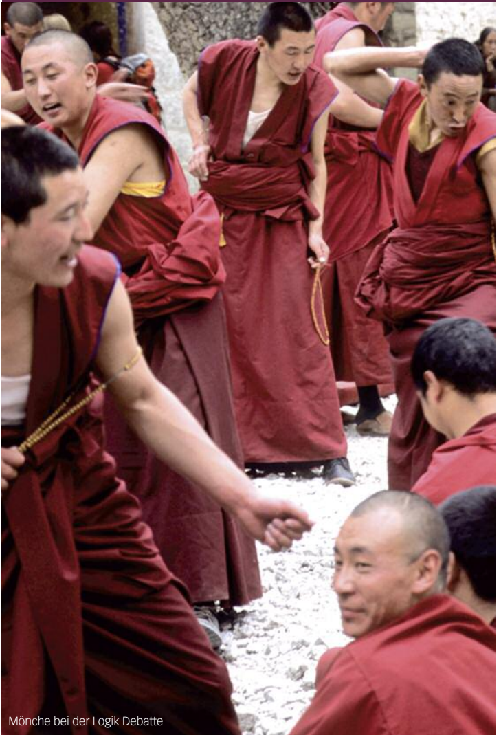
Mönche bei der Logik Debatte