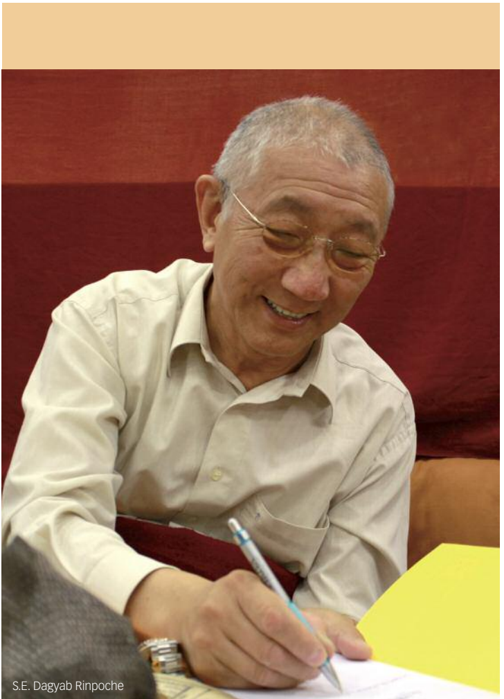
S.E. Dagyab Rinpoche