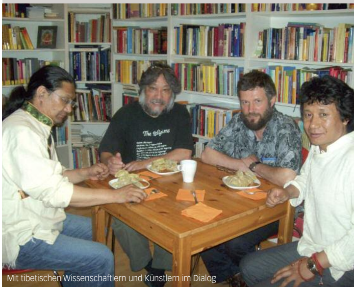
Mit tibetischen Wissenschaftlern und Künstlern im Dialog